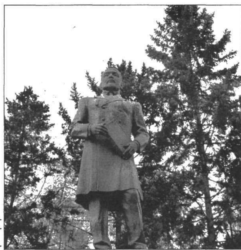
Новая награда Хакасии будет носить имя Н.Ф. Катанова

Интересно, как менталитет влияет на законодательскую деятельность. Так, например, даже звание «Почетный